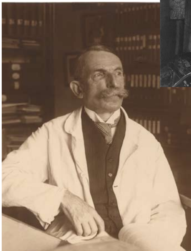
Hans de Winiwarter , photographie, s.d., Collections artistiques de l'ULg

Réservation souhaitée (contact : emicha@ulg.ac.be )